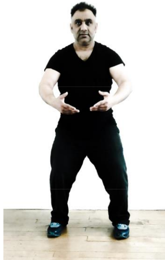
Fig.2 – Qigong dei Tre Cerchi Postura Inferiore

Durante l'importantissimo Qigong dei Tre Cerchi (vedi Figg. 1 e 2 sopra), trasmesso a TUTTI i principianti di Taiji all'inizio della loro pratica - indipendentemente dal fatto che si stiano allenando come artisti marziali o a scopi salutistici (che approfondirò più avanti) - ci viene detto di tenere la posizione superiore (Yang) per due terzi e la posizione inferiore (Yin) per solo un terzo del tempo totale.