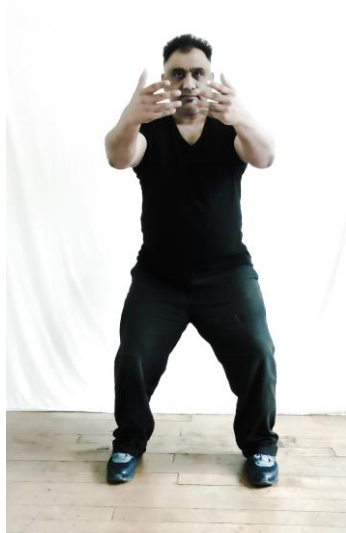
Fig.1 – Qigong dei Tre Cerchi Postura Superiore

Illustrerò ulteriormente questa 'discrepanza' con un altro esempio molto semplice: