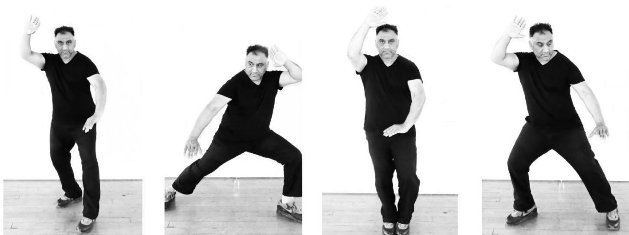
Sopra (da sinistra a destra): L' 'Airone Spiega le Sue Ali' classico e alcune delle sue varianti come appaiono nel Vecchio Stile Yang.

"La Medicina Tradizionale Cinese, insegna che molti disturbi e malattie sono causate da uno sbilanciamento nelle quantità di energia Yin e Yang nel corpo. Da qui derivano le grandi proprietà curative del Taijiquan, ma solo se praticato esattamente come è stato pensato originariamente, senza variazioni!"