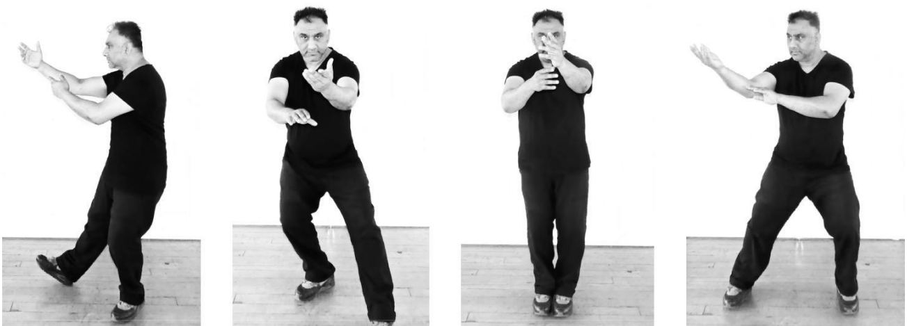
Sopra (da sinistra a destra): Mani Sollevate postura classica e alcune delle sue varianti come appaiono nel Vecchio Stile Yang.

La Forma è bilanciata attraverso gli aspetti passivi e attivi delle Tredici Dinamiche - sia fisicamente che internamente (energeticamente) – le quali appaiono attraverso la forma in vari modi e combinazioni. Queste stesse Dinamiche producono le polarità necessarie per spostare il Qi in tutto il corpo, non molto diversamente da una batteria moderna e, in tal modo, alcune 'posture' vengono ripetute più sul lato destro poi a sinistra in base al fatto che siano Yin o Yang, ma il bilanciamento è ancora raggiunto.